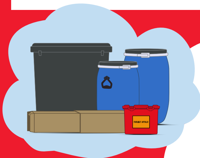
Eksempler på farligt affald